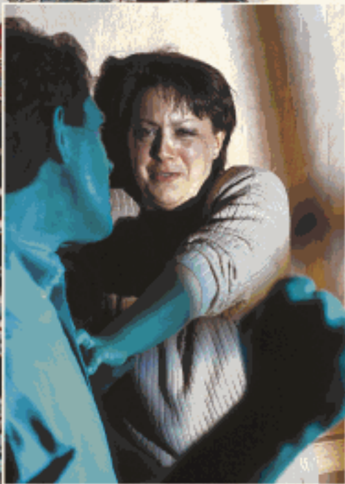
దేవుడు మన నుండి ఏమి కోరుతున్నాడు?

7. దేవుడు చెడ్డవని చెప్పేవాటిని చేసే వారు 'దేవుని రాజ్యమును స్వతంత్రించుకొనరు.' (గలతీయులు 5:19-21) మీరు నిజంగా దేవుని ప్రేమిస్తూ, ఆయనను ప్రీతిపర్చాలనుకుంటే మీరు ఈ అలవాట్ల నుండి దూరం కావచ్చు. (1 యోహాను 5:3) దేవుడు చెడ్డవని చెప్పేవాటిని ద్వేషించడం నేర్చుకోండి. (రోమీయులు 12:9) దైవిక అలవాట్లన్న ప్రజలతో సహాసించండి. (సామెతలు 13:20) పరిణతి చెందిన క్రైస్తవ సహవాసులు సహాయానికి మూలంగా ఉండగలరు. (యాకోబు 5:14) అన్నిటికి పైగా, ప్రార్థన ద్వారా దేవుడిచ్చే సహాయంపై ఆధారపడండి. —ఫిలిప్పీయులు 4:6, 7, 13.